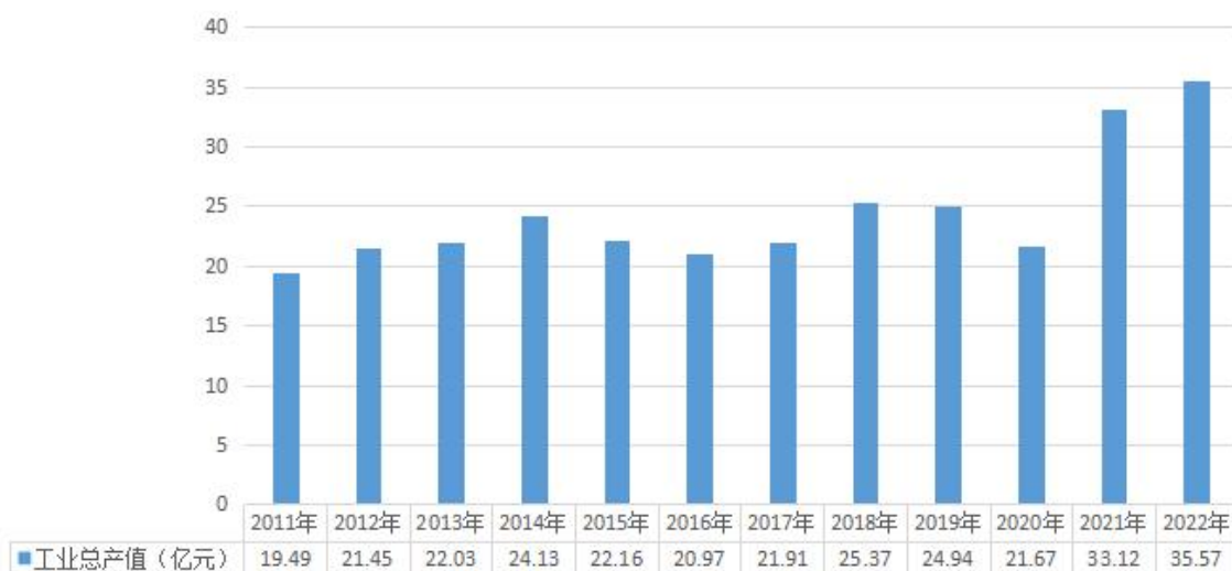
2011年-2022年规模以上工业总产值