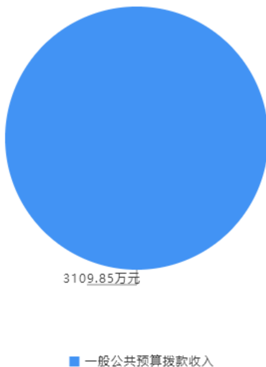
2024年收入预算构成图